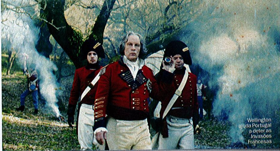
Wellington ajuda Portugal a deter as Invasões Francesas